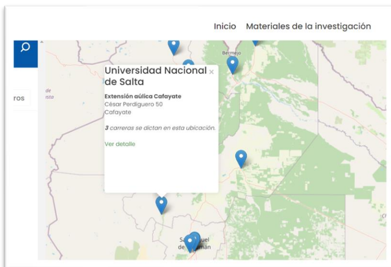
Ilustración 3. Ubicación y detalle de la oferta