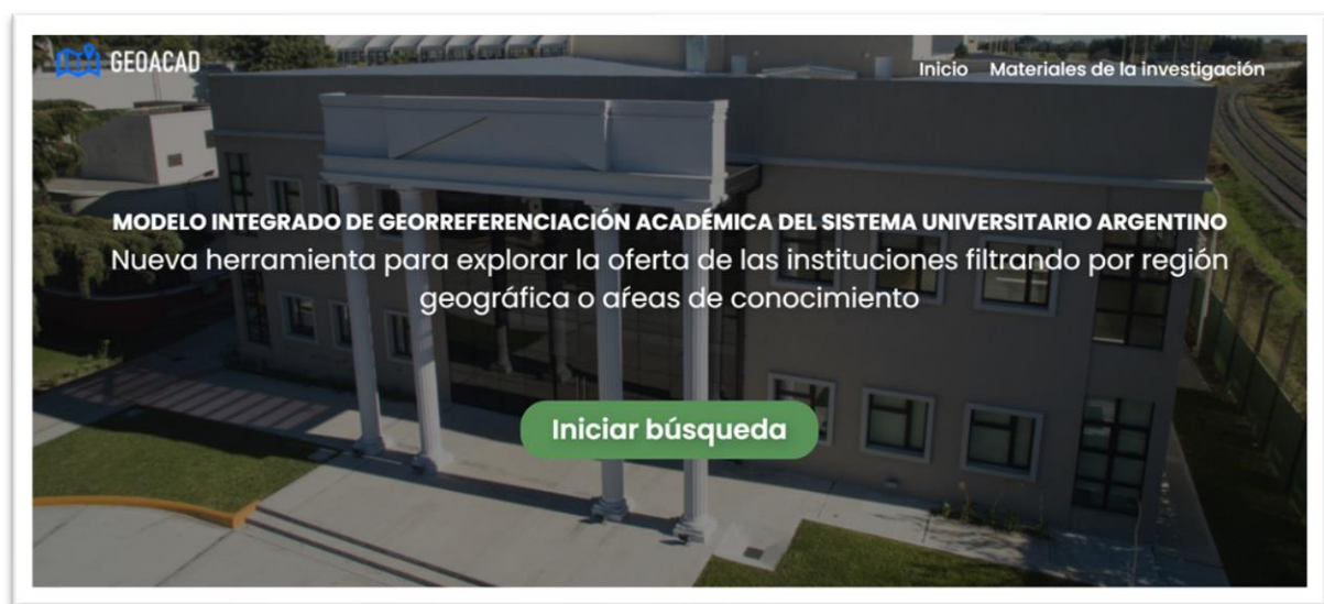
Ilustración 1. Portada del sitio que contiene el mapa de georreferenciación

Actualmente el recurso elaborado se encuentra publicado en un servidor de la Universidad Nacional de La Matanza, accesible desde https://cedit.unlam.edu.ar/mapas/