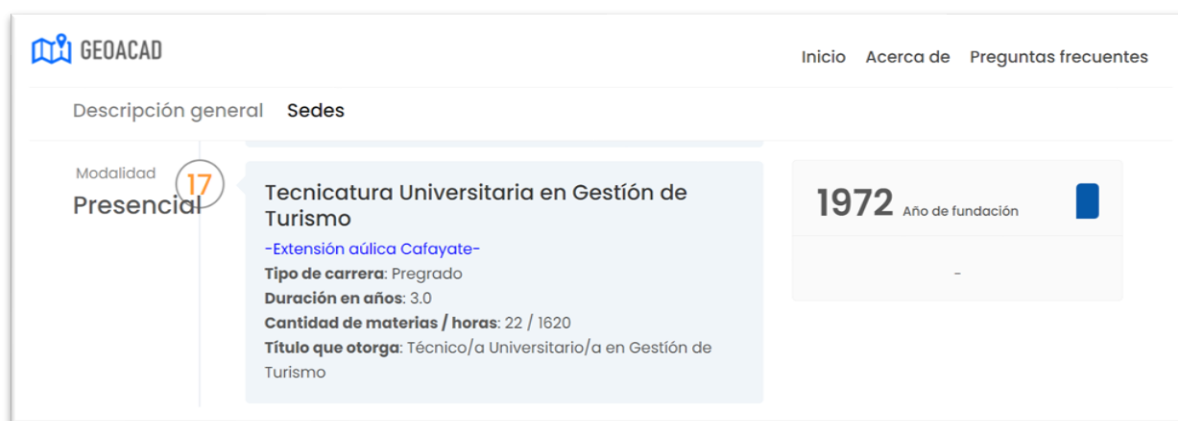
Ilustración 4. Detalle de carreras por sede

Al dirigirse a la leyenda Ver detalle aparecen las ofertas disponibles por sede con algunos de sus atributos más relevantes como puede verse en la Ilustración 4 en una de las carreras que se dictan allí.